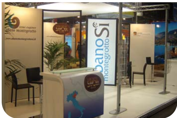
Lo stand alla Ferienmesse di Vienna

Il primo appuntamento è alla CMT Golf & WellnessReisen di Stoccarda (17-20 gennaio) che si svolge in contemporanea alla Ferienmesse di Vienna. Per dare continuità alla presenza in fiera verrà allestita una vetrina dal 15 febbraio al 15 marzo nella prestigiosa sede viennese dell'Enit, a due passi dall'Opera e dal Caffè Sacher, per organizzare un open day per la stampa di settore e i visitatori. Il nuovo sito www.abanomontegrotto.it e il libretto sulla "Prevenzione attraverso l'attività motoria" verranno presentati a giornalisti e ospiti, con degustazione di vini tipici.