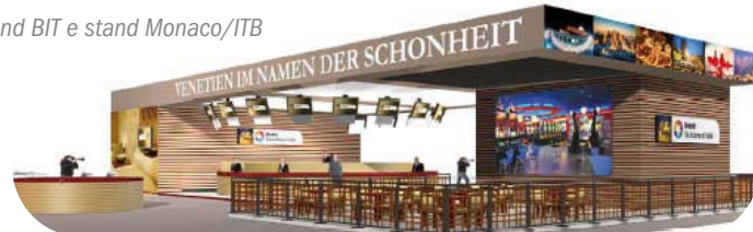
Stand BIT e stand Monaco/ITB

Per capitalizzare in termini di promozione sugli indirizzi degli interessati che si sono rivolti alle Terme per chiedere informazioni (al telefono, numero verde o per mail), il Consorzio ha mandato una comunicazione - a seconda del paese di provenienza - per invitare chi ci aveva contatto a visitare lo stand e a partecipare al sorteggio di un soggiorno gratuito alle Terme.